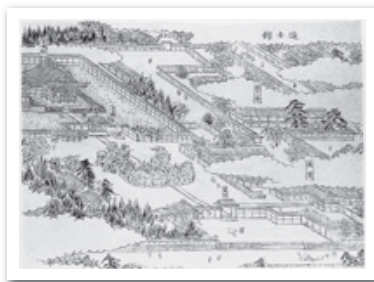
藩学造士館「三国名勝図会」