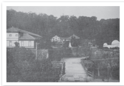
第七高等学校造士館前景